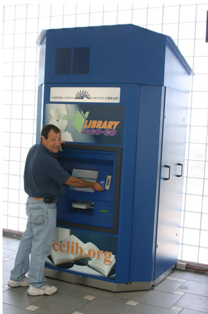
Biblioteca-a-Go-Go, Biblioteca del Condado de Contra Costa, Pleasant Hill, Calif.

atienden a empresas, organizaciones sin ánimo de lucro e instituciones gubernamentales)– se enfrentan a muchos de los retos de las bibliotecas públicas y las formas en las que respondan serán similares. Sin embargo, sus usuarios, contextos institucionales y objetivos son lo suficientemente diferentes como para justificar un tratamiento aparte en publicaciones posteriores.