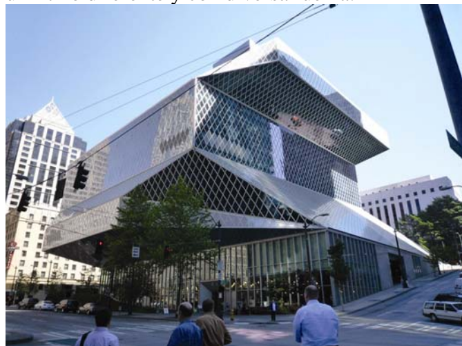
Biblioteca Pública de Seattle, Sucursal Principal.

En el 2011, y probablemente durante una gran parte de la próxima década, gobiernos de todos los niveles se enfrentarán a la necesidad de recortar servicios como resultado de los ingresos cada vez menores y de otras presiones presupuestarias. Inevitablemente, esta tendencia terminará por afectar a las bibliotecas. Más allá de este periodo, es imposible estimar la trayectoria de la economía y, consecuentemente, el grado en el que las restricciones económicas continuarán limitando las actividades de las bibliotecas. De las cuatro fuerzas mencionadas anteriormente, las dos primeras predominan en la discusión que sigue a continuación. En general, las consecuencias de la transformación demográfica y de las restricciones económicas, tendrán que ser asumidas por cada biblioteca al desarrollar sus servicios, ya que estas grandes fuerzas nacionales afectarán a cada sitio a un ritmo diferente y con diversa fuerza.