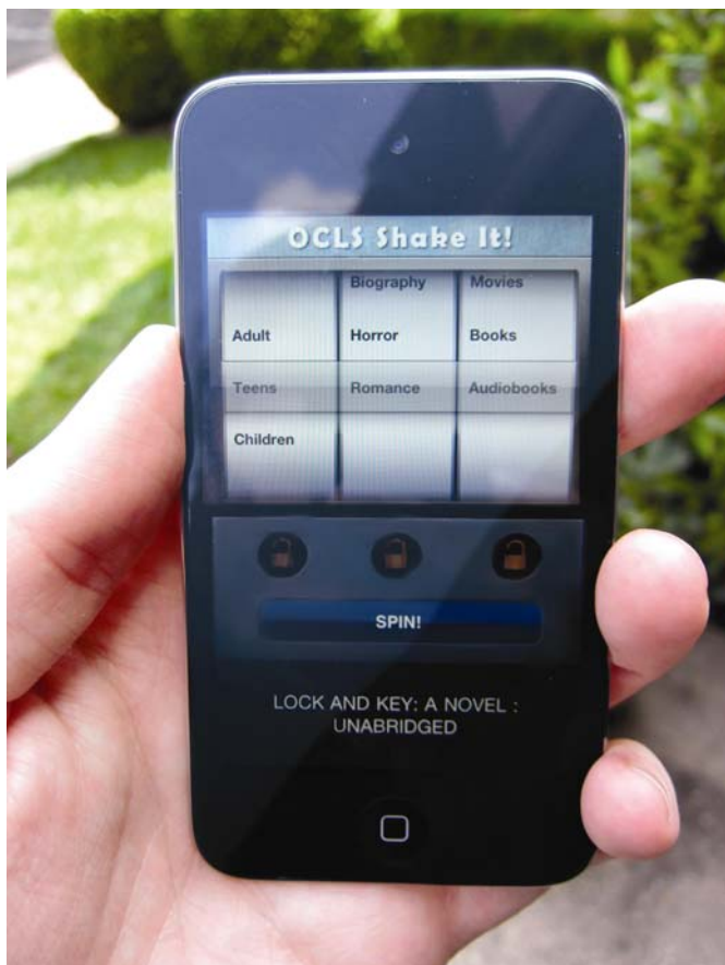
Aplicación “Shake It” para dispositivos móviles del Sistema Bibliotecario del Condado de Orange. En el 2011, la OITP

fuentes fidedignas. Sin embargo, a medida que envejece la generación de “nacidos en la era digital” y los buscadores mejoran continuamente, una parte cada vez más grande de usuarios potenciales de la biblioteca habrá utilizado frecuentemente herramientas de referencia en Internet desde sus años escolares y es probable que cada vez realicen menos peticiones a los bibliotecarios de referencia de su biblioteca pública local. No obstante, todavía habrá muchos que, a pesar de su destreza digital, no sean hábiles a la hora de encontrar, seleccionar y evaluar las fuentes de información que cada vez son más numerosas disponibles a través de la Web; otros que, aunque sean expertos en algunas disciplinas, puede que no estén familiarizados con áreas que pueden ser importantes para ellos y otros que, aunque poseen los conocimientos necesarios, prefieren ahorrar su valioso tiempo recurriendo a otras personas para que localicen el material que necesitan. Para estos usuarios, es probable que los bibliotecarios de referencia sigan siendo un recurso valioso, especialmente a medida que sean más accesibles a través de las redes sociales, los mensajes de texto y los servicios de chat.